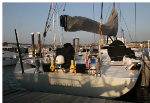
Mega 100 Fuss Rennyacht „Leopard“ in Southampton/ Solent – Arbeitsplatz der Profis!